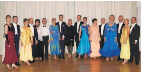
Gründungsmitglieder der TG Neuwied im Jahr 2004

Die Tanzgemeinschaft Neuwied e.V. wurde von 9 Turnierpaaren aus Neuwied und Umgebung gegründet. Seit Oktober 2003 ist die TG Neuwied im Vereinsregister der Stadt Neuwied eingetragen und seit Januar 2004 Mitglied im Tanzsportverband Rheinland-Pfalz (TRP) und im Deutschen Tanzsportverband (DTV).